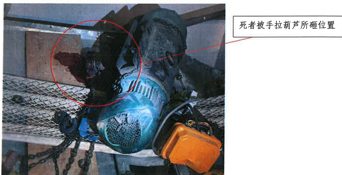
图 2 电动葫芦、手拉葫芦、简易货物平台坠落情况